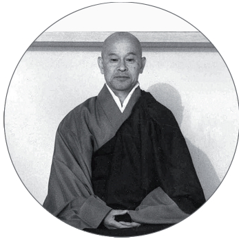
Shunryu Suzuki (1904 - 1971), zen leraar